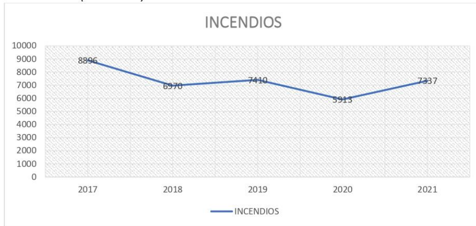
GRÁFICA 1. Número de incendios forestales en México durante los últimos cinco años (2017-2021)

* Gráfica de realización propia con información obtenida en el Cierre Estadístico 2021, en el link: https://www.gob.mx/cms/uploads/attachment/file/691111/Cierre_de_la_Temporada_2021.pdf