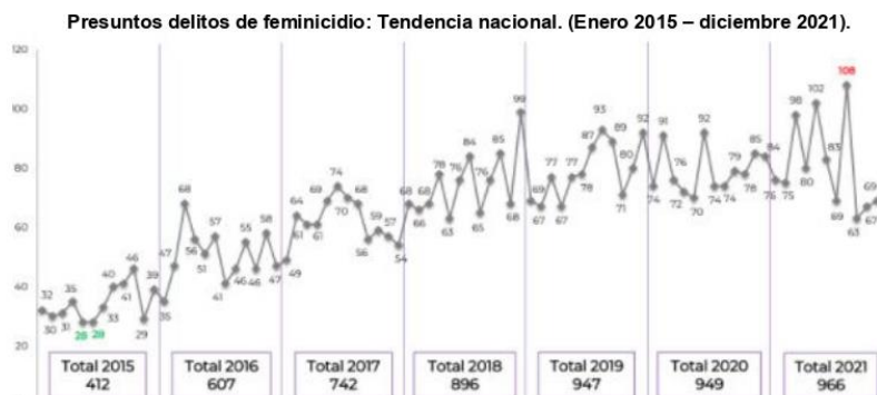
Fuente: Secretariado Ejecutivo del Sistema Nacional de Seguridad Pública (SESNSP), 2022.

En la actualidad, de acuerdo con el Informe sobre la Violencia contra las Mujeres, elaborado por el Secretariado Ejecutivo del Sistema Nacional de Seguridad Pública (SESNSP) 12 , se registró que de enero a diciembre de 2021 se cometieron 966 feminicidios.