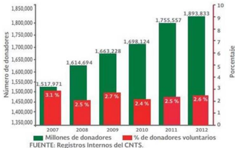
DONANTES DE SANGRE DEL PERIODO 2007 A 2012

La donación de sangre en México aún está lejos de las recomendaciones de la OMS, pues casi la totalidad de este valioso tejido es aportado por familiares, como una obligación para cumplir con los requisitos de hospitalización y cirugía de sus pacientes.